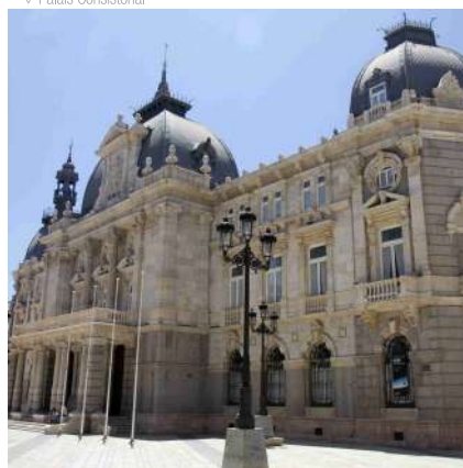
^ Palais Consistorial