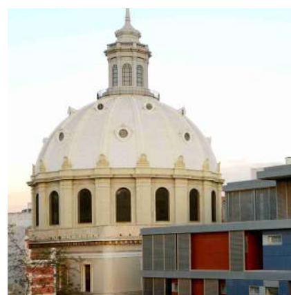
^ Basilique de la Caridad