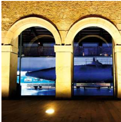
^ Musée Naval