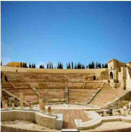
^ Théâtre Romain