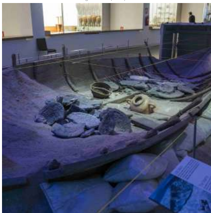
^ Musée National d'Archéologie Subaquatique, ARQUA