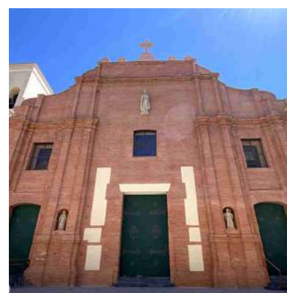
^ Église de Sta. Maria de Gracia