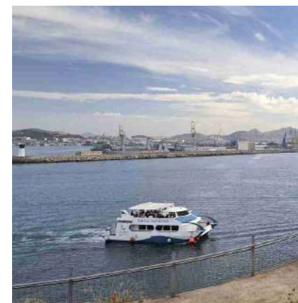
^ Bateau touristique