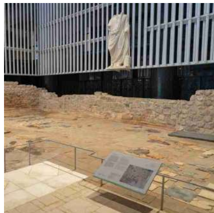
^ Roman Forum Museum