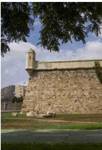
^ Muraille de Carlos III