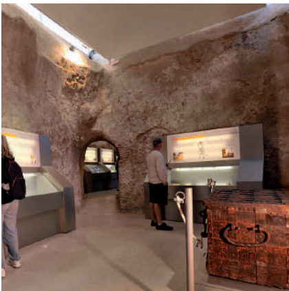
^ Centre d'interprétation de l'histoire de Carthagène