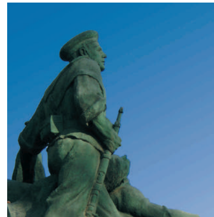
Monument aux Héros de Santiago de Cuba et Cavite

Plus d'informations dans turismo.cartagena.es