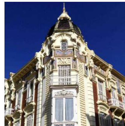
^ Maison Aguirre. MURAM