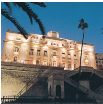
^ École des Gardes-Marines