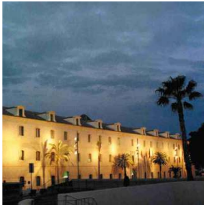
^ Campus Muralla del Mar